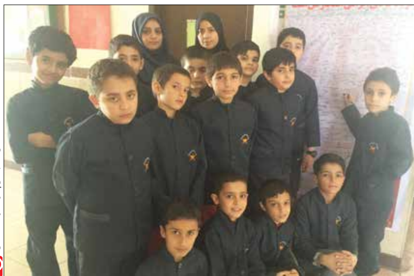
پسران در کلاس درس

از دست ندهند؟ خوشبختانه همه دوستانم با من موافقت کردند و بسرعت جمله‌هایی را که به ذهن شان می‌رسید، نوشتند و پایین برگه را امضا کردند. بعد هم این طرح را در مسابقه دهه فجر شرکت دادیم و تقریباً مطمئن بودیم که برگزیده می‌شویم.